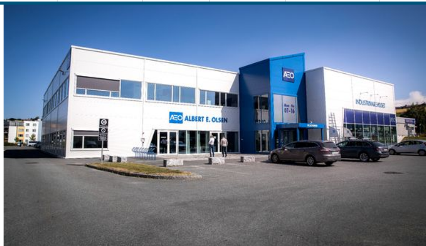
Tradisjonsrik: Albert E. Olsen AS hadde 137 ansatte da ledelsen begjærte oppbud i forrige uke.